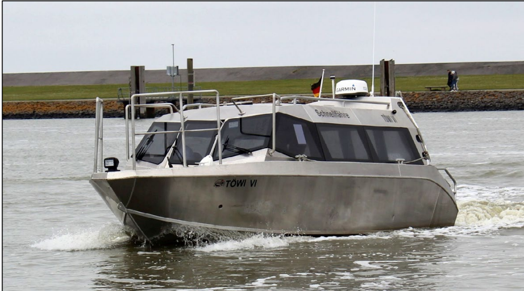
Abbildung 1: Kleinfahrzeug TÖWI VI 1